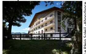
Le Plein Soleil - Abondance